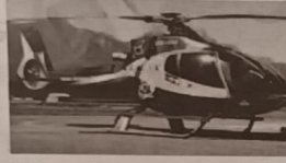
एयर एंबुलेंस सेवा। लखनऊ

उत्तर प्रदेश में आज रात में होने वाले लोकसभा आम चुनावों में किसी भी अचानक से निपटने के लिए उत्तर प्रदेश सरकार को तैनात रहेगी एयर एंबुलेंस व हेलीकॉप्टर की मदद से। इस एयर एंबुलेंस और हेलीकॉप्टर की मदद से किसी भी अचानक स्थिति से निपटने में 10 मिनट समय लगेगा जो काफी कम समय है। एयर एंबुलेंस और हेलीकॉप्टर की मदद से किसी भी अचानक स्थिति से निपटने में 10 मिनट समय लगेगा जो काफी कम समय है। एयर एंबुलेंस और हेलीकॉप्टर की मदद से किसी भी अचानक स्थिति से निपटने में 10 मिनट समय लगेगा जो काफी कम समय है।